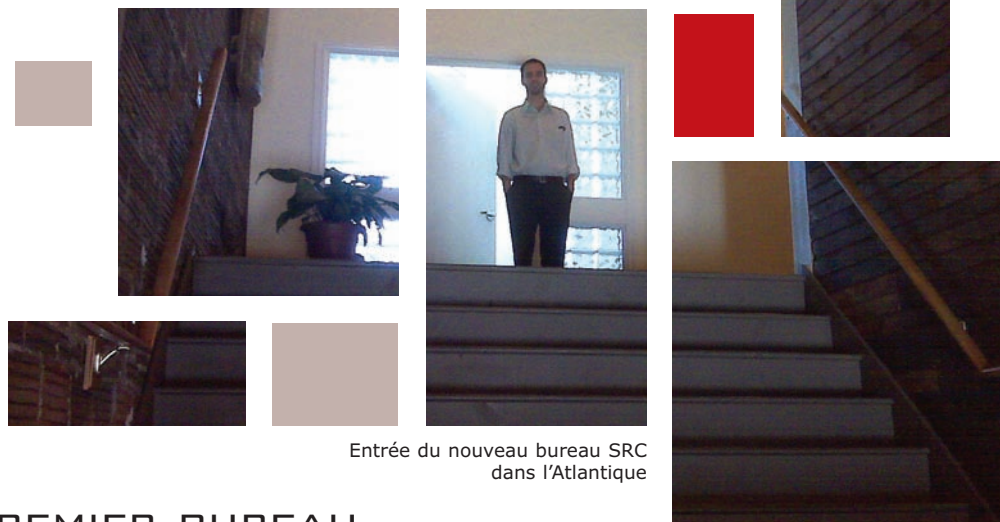
Entrée du nouveau bureau SRC dans l'Atlantique