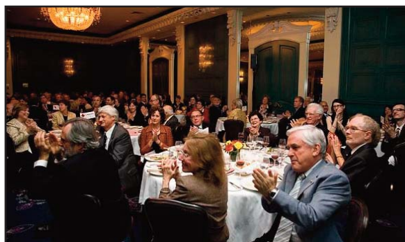
Gala de levée de fonds de la SRC à Toronto, le 17 octobre dernier.